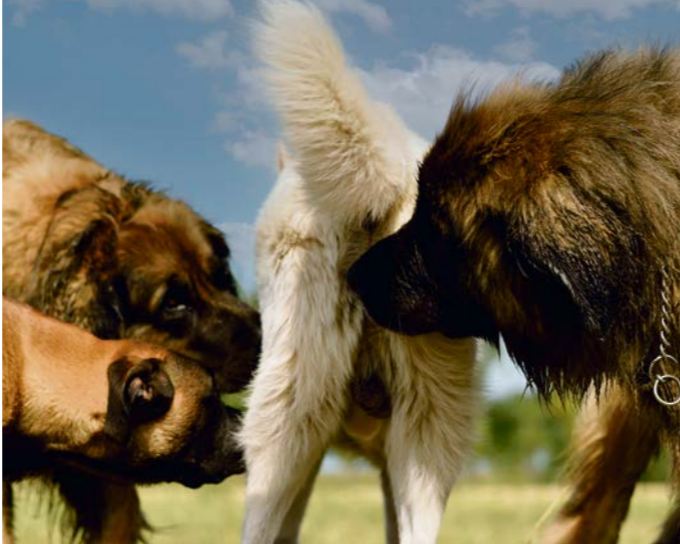
Unkastrierte Rüden sind oftmals stark auf Hündinnen fixiert und werden aufdringlich.