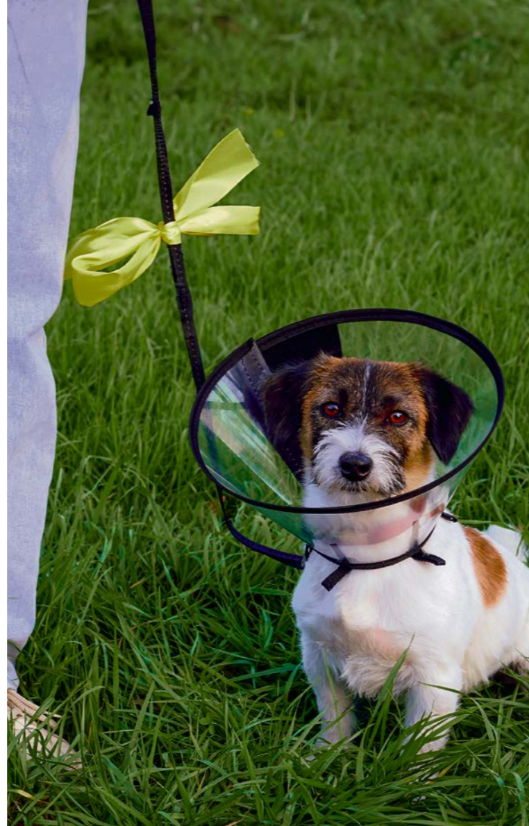
Die gelbe Schleife signalisiert ganz klar: Dieser Hund möchte keinen Kontakt zu anderen Hunden oder auch Menschen.